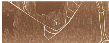
As xilografías están discretamente asinadas co inicial S. realizada tamén con incisión na prancha de madeira

Cada lámina leva inscrito o título correspondente, realizado con incisión xilográfica, entintado e formando parte do propio deseño. Sorprende a coidada elección de cada unha das frases ou sentenzas coas que o autor acompaña as figuras. Con elas fai referencia a unha acción, unha sensación, un parecer co que Seoane intencionadamente, valéndose dun recurso literario, personifica aos insectos representados. A súa obra plástica conecta coa súa obra literaria, a que mantivo ao longo da súa vida con múltiples proxectos editoriais e destacada actividade en semanarios políticos e revistas de arte e literatura.